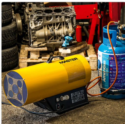
Officina Master BLP 17M