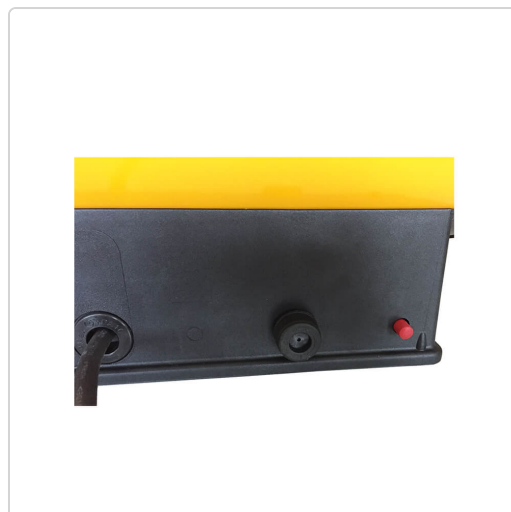
Pannello di controllo Master BLP 33 M