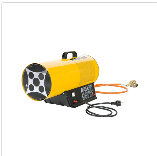
Master BLP 33 M – riscaldatori d'aria diretti a gas

I riscaldatori a gas Master generano grandi volumi di calore istantaneo. Sono molto economici, robusti ed efficienti. I riscaldatori a gas portatili sono progettati per aree ben ventilate come cantieri, magazzini o fabbriche.